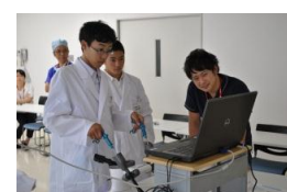
腹腔鏡下シミュレーション