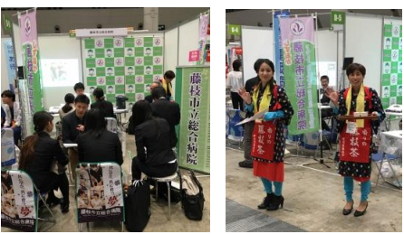
昨年度レジナビフェアの様子