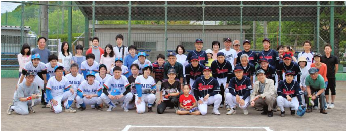
平成28年6月4日 藤枝市民グラウンド野球場