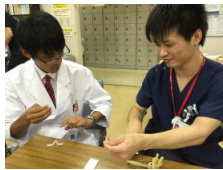
見学医学生と糸結び練習

4月からの医学生病院見学者が51名となりました。各診療科の指導医、研修医の先生方には日常業務のお忙しい中、毎回懇切丁寧な対応をいただきありがとうございます。また、研修医の先生方は研修医室に戻ってからも、先輩たちに糸結びの指導をするなど後輩想いに感謝します。 左記に見学者からのアンケートを掲載します。 今後とも、『選ばれる病院』を目指し皆さんのご理解ご協力を願ひします。